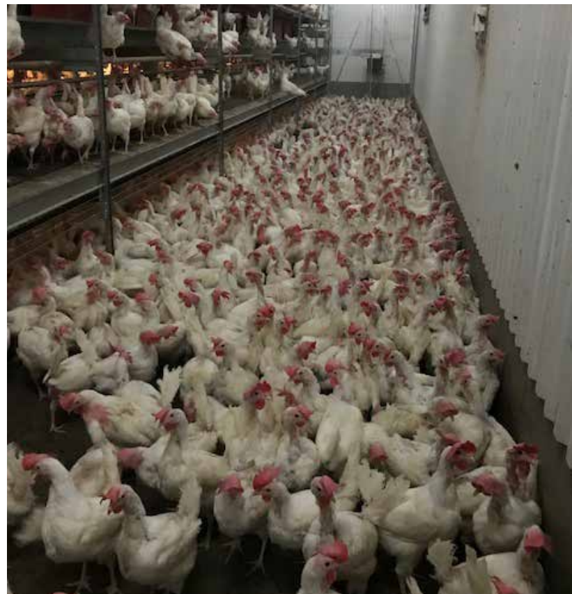
Frigående höns i ett flervåningssystem.

Frigående höns är benämningen men kanske skulle fristående höns vara mer korrekt benämning? Denna frigående variant är den vanligaste produktionsformen i Sverige idag och innebär att hönsen är fria att röra sig på en gemensam yta med tusentals andra höns. De frigående hönsen kan röra sig men det är trångt då det är tillåtet att hålla så många som nio höns på en kvadratmeter. Det finns envånings- och flervåningssystem. Flervåningssystemen har flera hyllor och hönorna kan alltså välja på vilken höjd över golvet